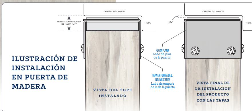
ILUSTRACIÓN DE INSTALACIÓN EN PUERTA DE MADERA